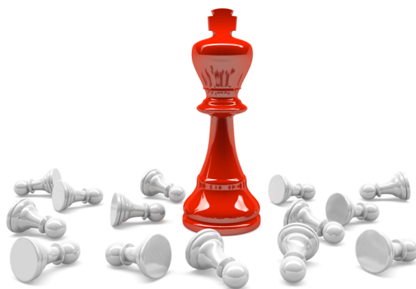
Bezkonkurencyjne podejście do restrukturyzacji przedsiębiorstwa.